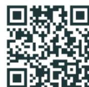
Illustration réalisée par :